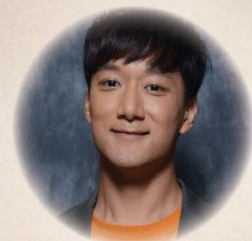
嘉賓：彭紀諺 (基督徒歌手，藝人， 歌唱指導)